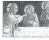
„Eucharisziának” nevezi, ami tudvalevően hálaadás jelent. Ez a név aztán megmaradt a görög és latin használatban, míg később a középkorban a latin „mise” kifejezést használták, mert ezzel fejeződött be a szentmise: „Ite, missa est!”, vagyis ezzel bocsátották el a híveket: „Menjete megvalósítani mindazt, amit a szentmisében megéltetek” - (Festinet nunc unusquisque opera bona facere).

MIÉRT ALAPÍTOTTA JÉZUS AZ EUCHARISZTIÁT?