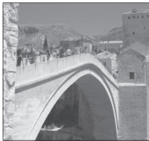
A mostari híd, amelyet a délszláv háború idején leromboltak

újraépítés kezdetekor, 2003-ban mind a bosnyák muzulmán, mind a horvát keresztény lakosság azt szerette volna, hogy az új híd a több száz éves formáját nyerje vissza. Ez a híd jelentette számukra a kapcsolatot a két kultúra között, ezért ragaszkodtak emyire az Óreg hid formájához. A helyreállítási munkálatokat magyar hidépítő mérnökök kezdték el. Ők emelték ki a Neretvából a lerombolt kőtömböket, rövidesen török kőfaragók csatlakoztak hozzájuk a további teendők elvégzésére.