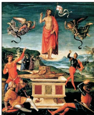
Raffaello, Sanzio (1483–1520): Krisztus feltámadása

„Felhangzik az örvedetes hűsvéti üzenet: Krisztus feltámadott! Valóban feltámadott! Ő, aki »szenvedett Poncius Pilátus alatt, keresztre feszítették, meghalt és eltemették«, Jézus Krisztus fia, aki Szűz Máriától született, »harmadnapra feltámadott az írások szerint«.