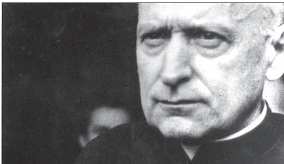
Mindszenty József bíboros egy archív felvételen

MUK időszakában nem egy békepap őrizetbe vételét is elrendelték. Az ateista államgépezet a forradalmi erő levertését, és hatalmuk végleges megerősítését szükség szerűen a kommunizmus egyik alapvető célkitűzésének megvalósítására is felhasználta. Ez pedig nem volt más, mint a vallás fokozatos elorsvasztása, és – ennek érdekében is – lehetőleg minél több pap megnyerése a kommunista állam érdekeinek kiszolgálására.