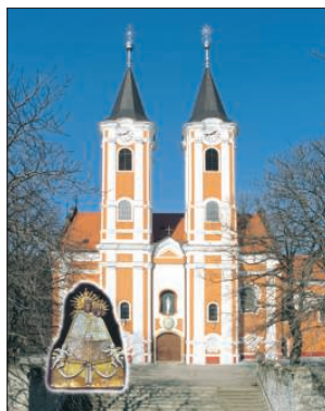
A máriagyúdi kegytemplom és -szobor