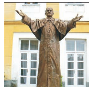
Mindszenty bíboros szobra az esztergomi Mindszenty iskola udvarán

A forradalom és szabadságharc iránt érzett rokonszenv és együttérzés a papság körében nem mindenütt mutatkozott meg egyforma módon és erősséggel. Az azonban biztos, hogy a papság mindent a rábízott érdekeit tartva szem