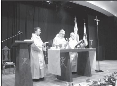
Szentmise a Szent Gellért Apátságban