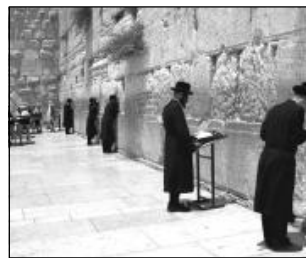
Ortodox zsidók imádkoznak a Siratófalnál

A zsidóság nagy többsége a diaszpórában úgy éli meg életét, mint egy sérelmes küzdelmet a túlélésért. Úgy érzi, hogy a katolikusok szüntelenül meg akarják téríteni őket, kedvesen vagy sokszor erőszakosan. A zsidóság ellenérzé-