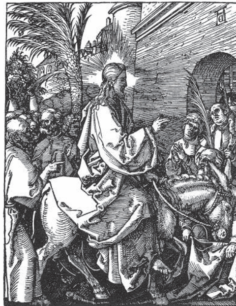
Jézus bevonulása Jeruzsálembe Albrecht Dürer fametszete 1511. A „Kis passió” 22. lapja

A Betlehem melletti, istállóként használt barlangban született Gyermekek harminchárom évet élt meg, amikor az átmenet-ünnep hajnala fénylővé vált, olyannyira