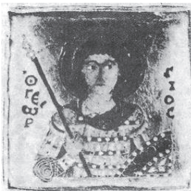
A Szent Korona Szent György-képe

Az esztendő negyedik hónapját, melyben rend szerint a húsvétot ünnepeljük, régi magyar kalendáriumaink Szent György havának nevezik. A keresztény ókor vitéz vértanúja megszemélyesíti a kikelet tavasi hónapjában a Világosságnak a Sötétség fölötti győzelmét, az isteni Jóságnak a Gonoszszágon aratott diadalát. Ennek a hősie győzelemnek